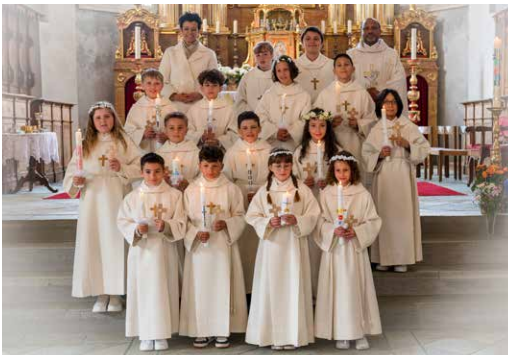
Nos premcommunicants (sura e nos confirmands (sut) 2025