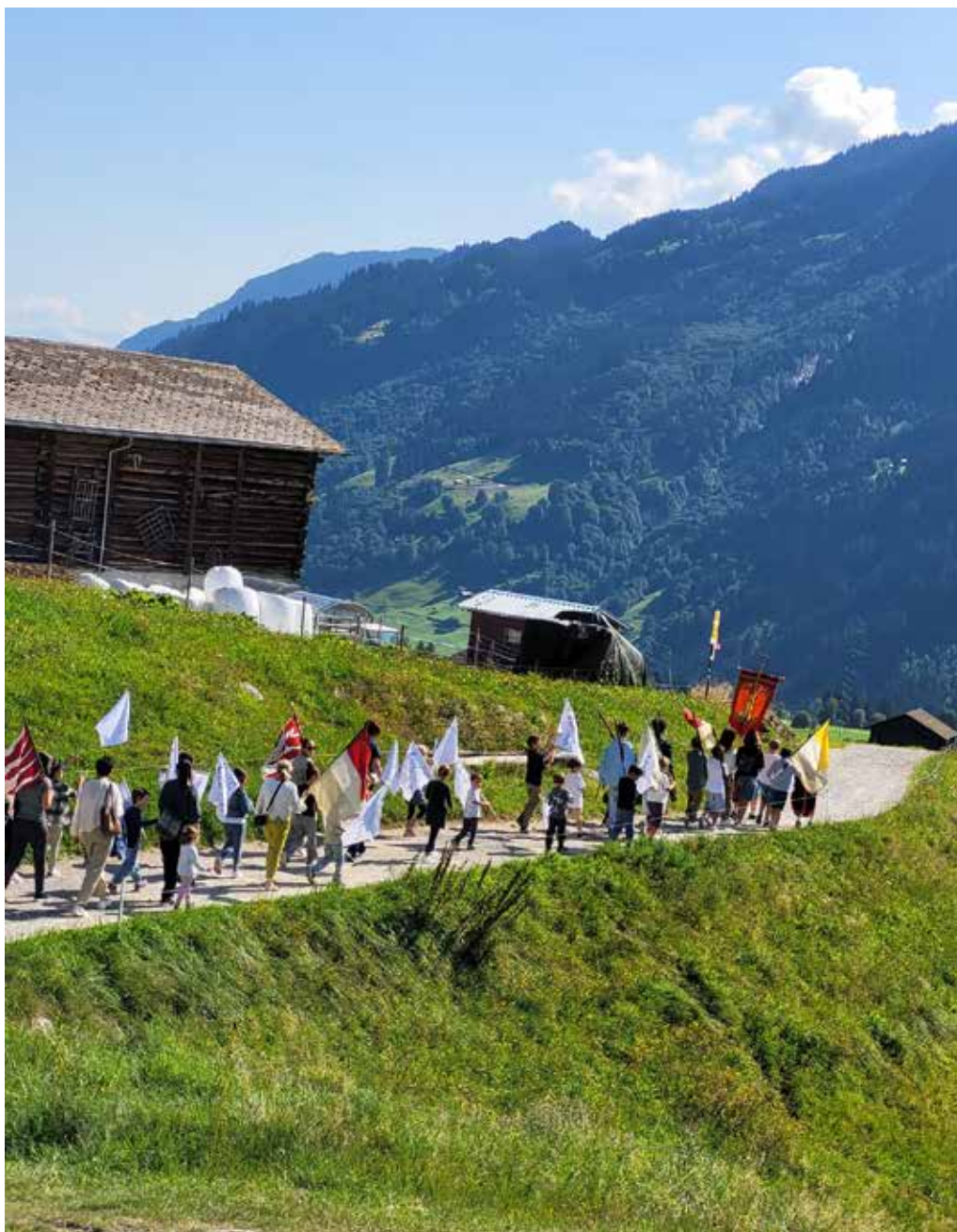
1949 han ils affons da Vitg/Mustér fatg la davosa gada processiu da s. Roc a Segnas. Il Salid dil Segner ha schau reviver 2025 quei usit e rodund 15 affons dapli ein vegni per separticipar a quella processiu particulara ed unica.