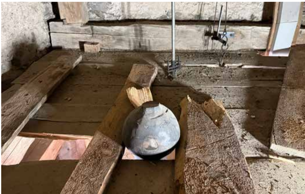
La rucla dil battagl ch'ei vegnida retenida dil plantschiu. Las aissas dalla vart ein piazzadas per impedir che la rucla crodi vinavon.