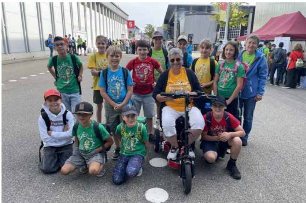
Ministrantas e ministrants a S. Gagl