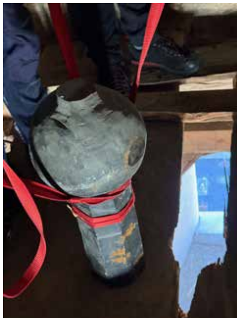
La rucla dil battagl culla crena da ruina (sen.). La fin dil battagl da ca. 100 kg (dretg)