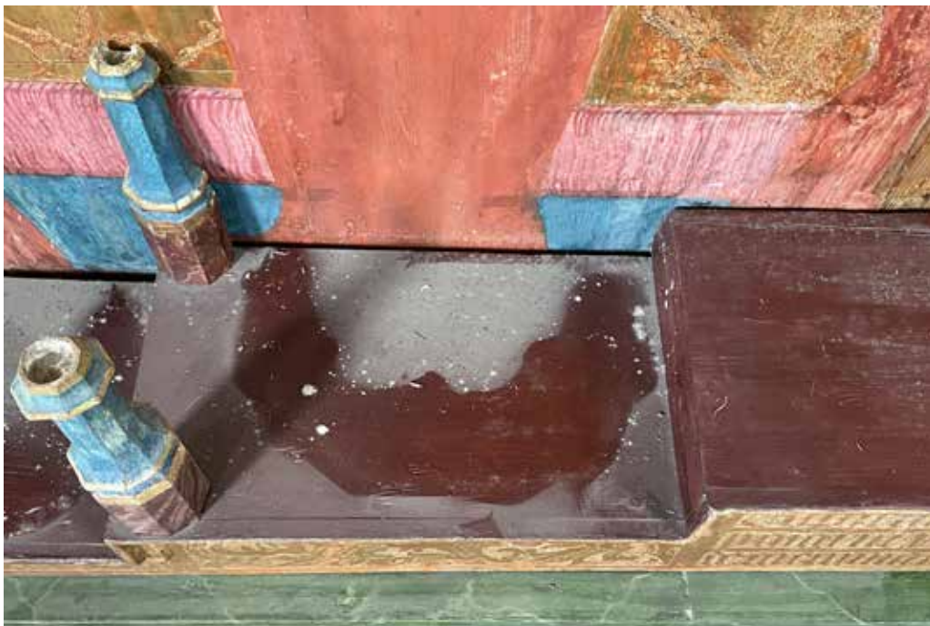
Il s tacs alvs ein bulius che han taccau igl entir altar. Sut vesan ins igl altar restaurau.