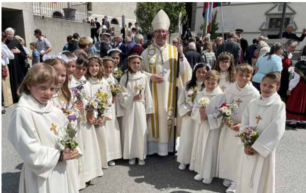
Il premcommunicants da Sontgilcrest (U. Defuns)