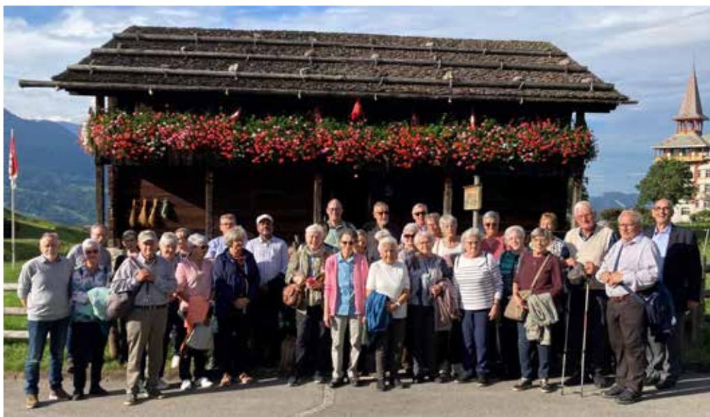
Participontas e participonts al peleginadi tier Fra Clau da Flia (T. Hendry)