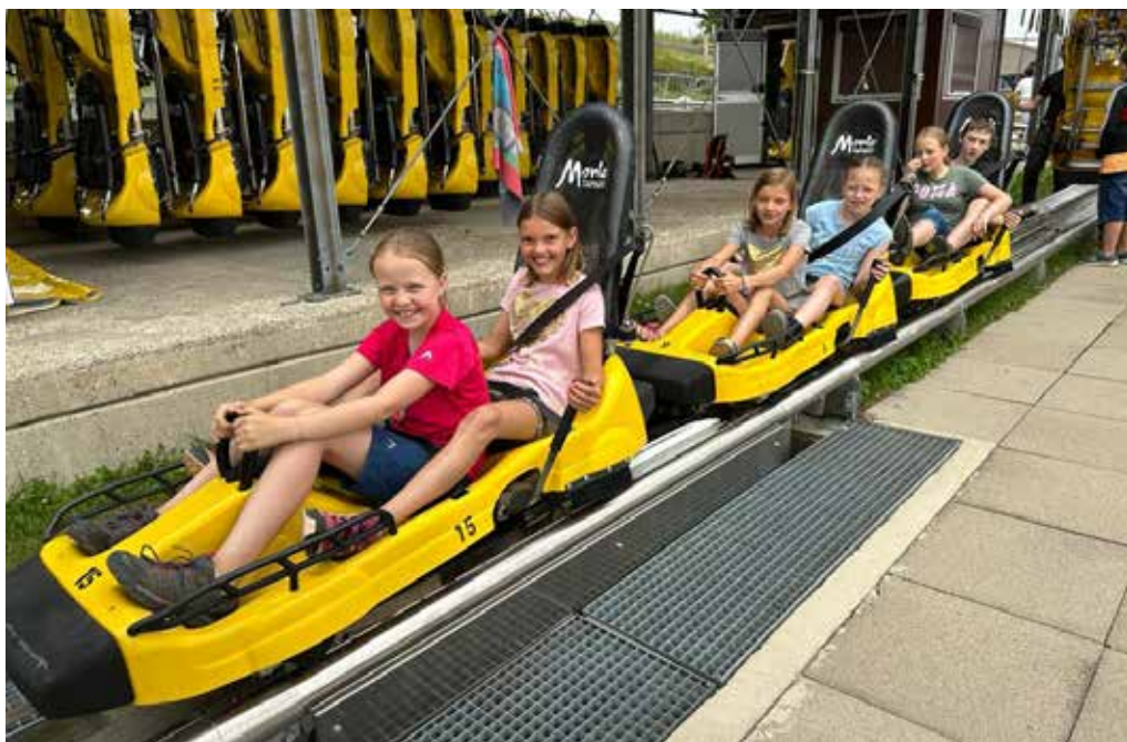
Il ministrants sin viadi sil Monte Tamaro (J. Lombris)