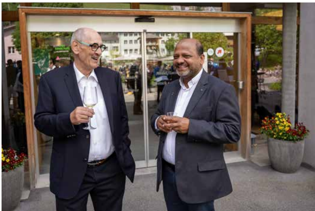
President e plevon a caschun d'ina sentupada (Paul Duff)