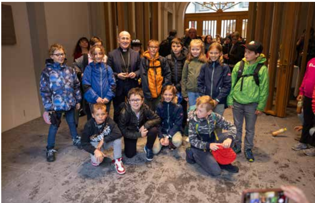
Sentupada cugl uestg a caschun dil di da ministrantAs a Cuera (C. Defuns)