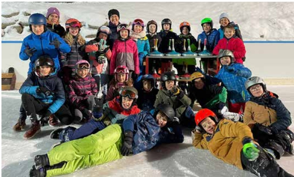
Ministrantas e ministrants han tratg tschoccas sil glatsch dil Center Fontauna