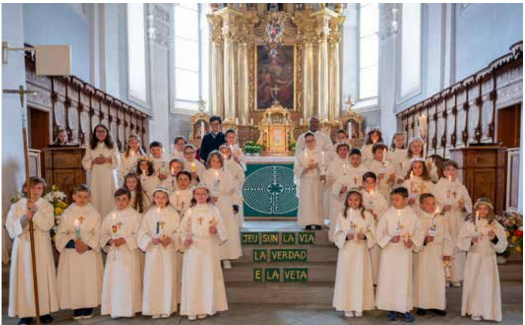
Il premcommunicants dad uonn

Scolaras e scolars dalla tiarza classa sorprendan mintgamai il survetsch da ministrar quei onn ch'els astgan retscheiver l'emprema sontga communion. Legreivlamein stattan era suenter quei onn adina puspei in per dad els vinavon a disposiziun per survir al