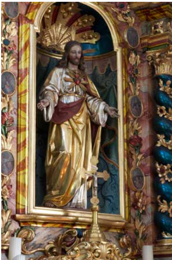
Statua dil s. Cor da Jesus en baselgia a Cavardiras